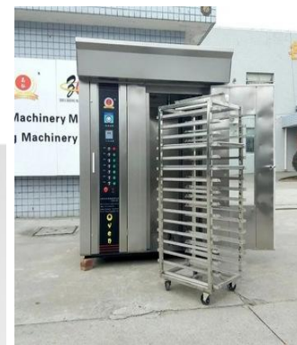
Horno y estantería