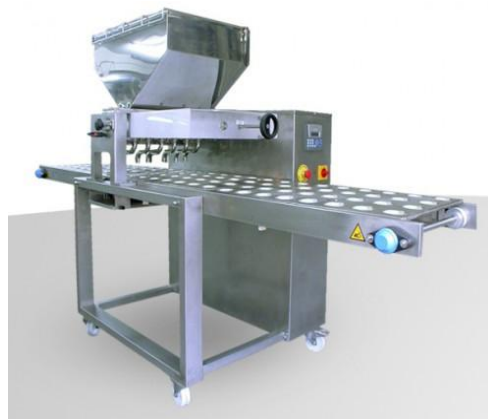
Dosificadora de masa