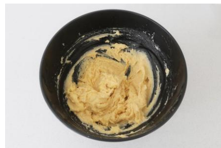
Mezclar los ingredientes de la masa