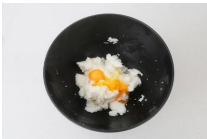
Mezclar la manteca, el azúcar y las yemas de huevo

12. Cuando la parte de arriba esté doradita ya estarán listas. Retíralas de la bandeja con una espátula y déjalas enfriar sobre una rejilla.